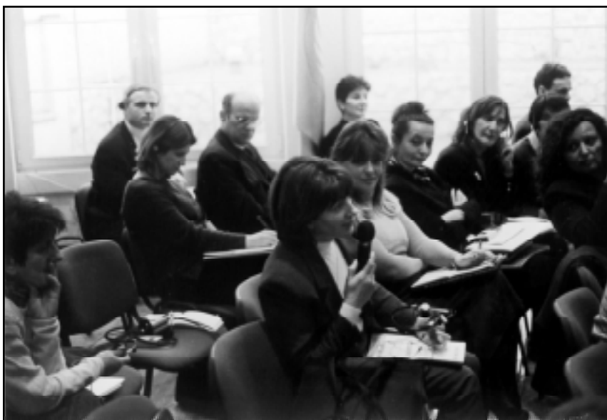
Veliko interesovanje za iskustva Budimpešte u privatizaciji komunalnih usluga