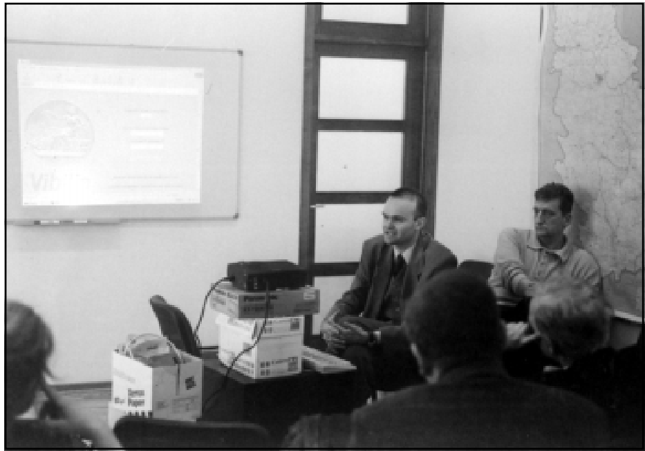
Prezentacija softvera za vođenje opštinskog budžeta

Iskustva drugih istočnih zemalja, pre svega naših suseda, pokazuju da ovo pitanje iziskuje posebnu