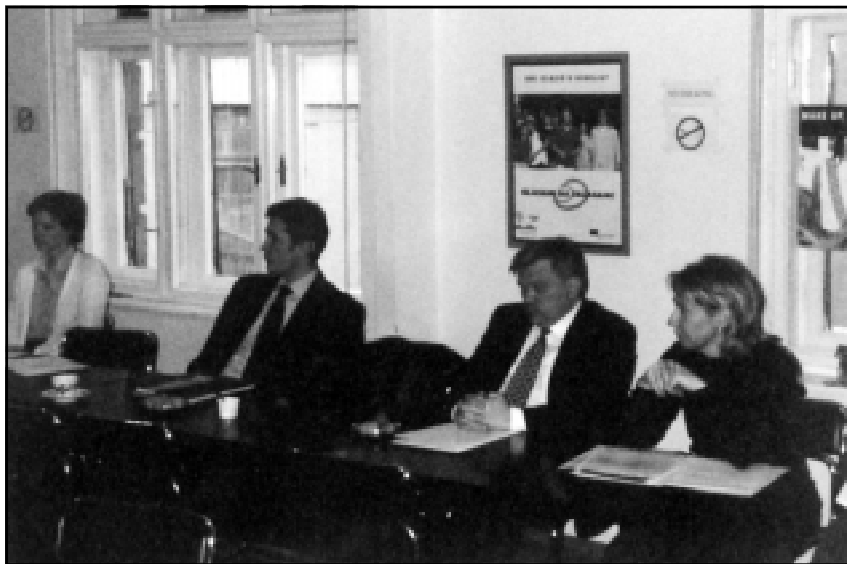
Sa Osnivačke skupštine Transparency International Srbija