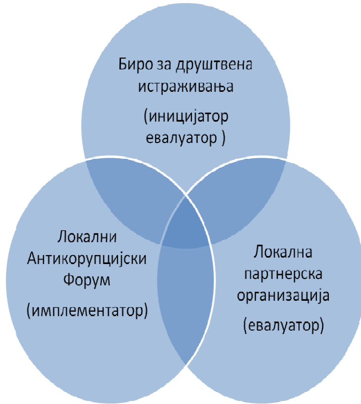
Схема 1. Актери у процесу креирања, реализације, мониторинга и евалуације Локалног плана за борбу против корупције