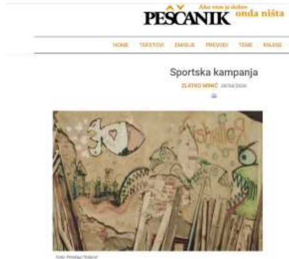
U rubricnim oglasima dizajner Bilić podnosi prijavu zbog kršenja zakona o finansiranju političkih

on „ne zna niti ga to interesuje“ jer je kao v.d. direktora davao izjave novinarima, što redovno čini, „jer da to ne čini bio bi u velikim problemima“, a on „ne zna kako se taj naziv liste našao na video snimku niti ko ga je postavio“.