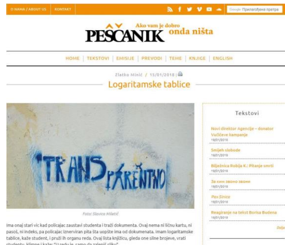
ima onaj stari vic kad policajac zaustavi studenta i traži dokumenta. Ovaj nema ni ličnu kartu, ni pasuž, ni indeks, pa policajac iznervisan pita šta onaj ima od dokumenata. Imam logaritamske tablice, kaže student, i pruži ih organu reda. Ovaj lista knjžicu, gleda one silne brojeve, vrati studentu, klimne i kaže: "U redu je, samo da zalepiš sliku".

A kada se otvori nova afera, mogu da nam kažu da to nema veze sa njima. Neko im je ukrao logaritamske tablice..