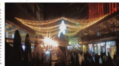
Najveći dan kulisa firmi Keep light: Novogodišnja svetla u Beogradu

Beograd - Javne nabavke novogodišnjeg osvetljenja u pojedinim gradovima Srbije sprovedene su tako da nedvosmisleno favorizuju određena preduzeća. Tako su Beograd i Smederevo u konkursnoj dokumentaciji priložili fotografije ukrasa kakve žele na svojim ulicama, dok su druga mesta poput Novog Sada i Valjeva pružila detaljan opis dekorativnih elemenata koji obuhvata i najsitnije detalje. Na taj način prednost u nadmetanju imale su one firme koje uvoze ukrase čiji je opis, odnosno slika, pružen u konkursnoj dokumentaciji. Nemanja Nenadić, programski direktor Transparency Serbia, kaže za Danas da način na koji su postavljeni uslovi u konkursnoj dokumentaciji u pomenutim gradovima budi sumnju.