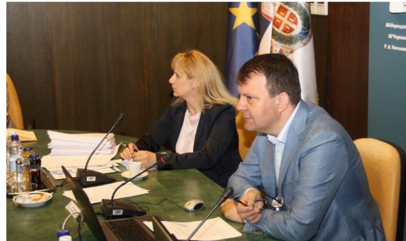
Саопштење са седнице Покрајинске владе