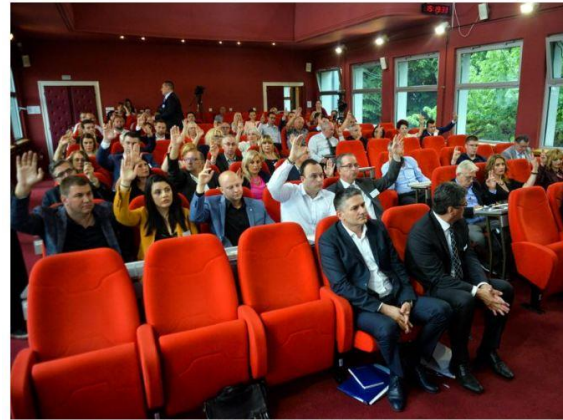
Odbornici vladajuće većine glasali 'za', foto: Vanja Keer

Istina, u dokumentu se pominje da je za ulaganja i realizaciju strategije razvoja potrebna podrška Države ili obezbeđivanje sredstava na tržištu kapitala, ali ne i informacija o tome da postoji neki problem da se sredstva obezbede na taj način niti da li je o tom uopšte bilo govora na relaciji Grad Niš – Republika Srbija.